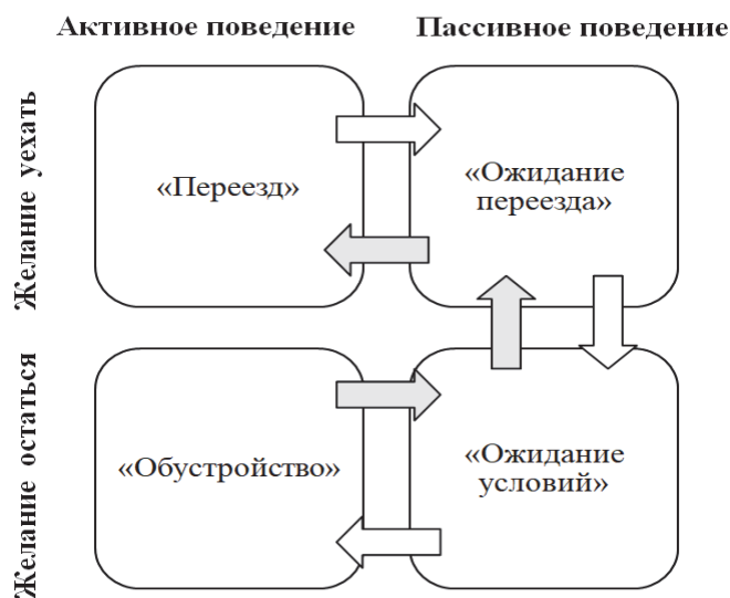
Рис.3 Варианты последовательности перехода между миграционными стратегиями Fig. 3 Options for the transition sequence between migration strategies

Выбор стратегии определяется в большей степени не тем, каковы условия предполагаемого места жительства, поскольку получение информации о нем ограничено, а существующим окружением и его способностью удовлетворить потребности.