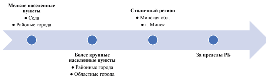
Рис. 3. Миграционные движения населения Республики Беларусь

значительные миграционные потоки внутри страны происходили из города в город и из села в город [7]. В исследуемом периоде продолжил иметь место отток населения из села. Преобладающее направление внутривнутриреспубликанской миграции – это Минская область и г. Минск. Обобщив миграционные движения населения страны, можно структурировать их направления следующим образом: население движется из мелких населенных пунктов в более крупные населенные пункты, затем в столичный регион и за рубеж (рис. 3).