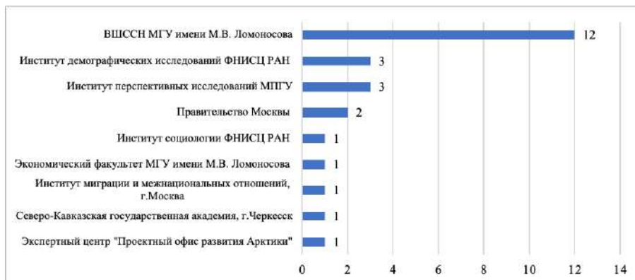
Рис. 1. Образовательные и научные организации, представители которых приняли участие в заседании круглого стола 07.10.2022 г. (человек)

сотрудники, аспиранты и студенты. Большинство участников заседания составляли представители МГУ имени М. В. Ломоносова – 13 человек, из которых 12 – преподаватели и студенты ВШССН (рис. 1). Интерес к тематике заседания проявили представители Института демографических исследований (ИДИ) ФНИСЦ РАН и Института перспективных исследований Московского педагогического государственного университета (ИПИ МПГУ), а также работники аппарата Правительства Москвы. Всего в мероприятии участвовали представители восьми подразделений образовательных и научных организаций г. Москвы и представитель Северо-Кавказской государственной академии, г. Черкесск.