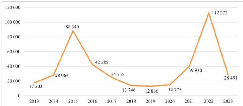
Рис. 4. Динамика поданных ходатайств на получение статуса беженца в Австрии в 2013–2023 гг.

который формирует правовую основу интеграции непосредственно иностранцев, подавших ходатайство на получение статуса беженца или нуждающихся в субсидиарной (вспомогательной) защите лиц в возрасте старше 15 лет. Таким образом, все прибывшие обязаны подписывать т. н. согласие на участие в осуществляемой государством интеграции, подразумевающей регулярное посещение и окончание специальных курсов по изучению традиций страны пребывания и немецкого языка с получением сертификатов. Отказ от посещения учебных занятий несет для беженцев правовые издержки, в т. ч. сокращение объемов оказываемой финансовой поддержки. При федеральном министерстве по делам Европы, интеграции и внешних сношений функционирует экспертный совет по интеграции и мониторингу процессов в сфере миграции.