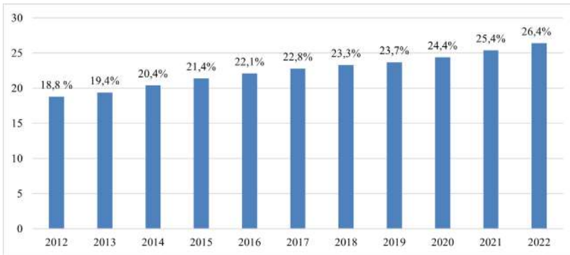
Рис. 1. Доля выходцев из семей с миграционными корнями в населении Австрии в 2012–2022 гг.

ния; 2015 г. – 1,81 млн или 21,4%; 2021 г. – 2,24 млн или 25,4%; 2022 г. – 2,4 млн или 26,4%) 3 (рис. 1).