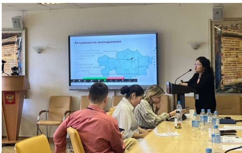
Рис. 2. Работа летней школы Pic. 2. Work of the Summer School