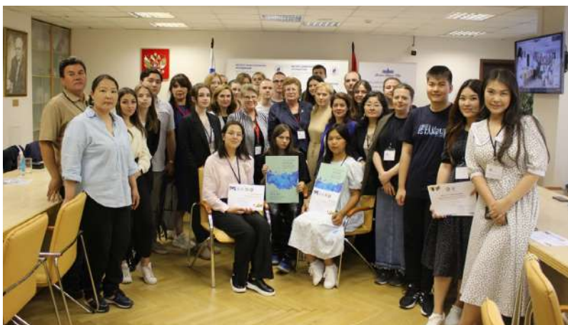
Рис. 5. Участники летней школы